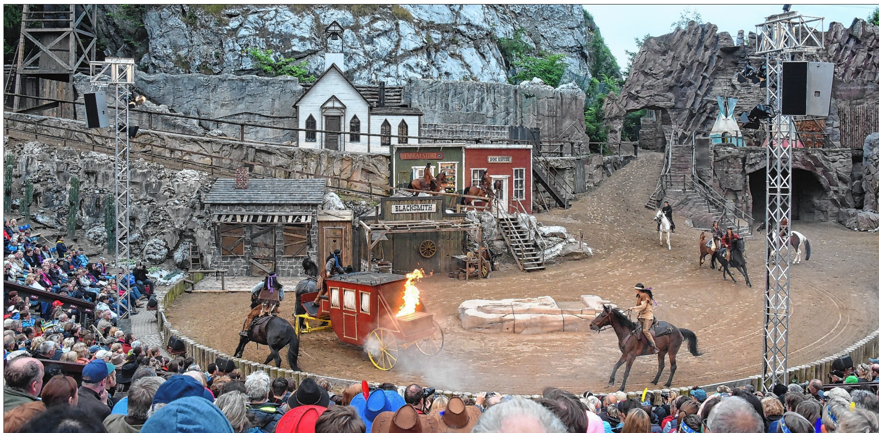
Solche Szenen wie bei den Karl-May-Festspielen in Bad Segeberg wird es vorerst nicht mehr geben.

Das Baselbieter Strafgericht verfügte neben der unbedingten Freiheitsstrafe, die von einer ambulanten Therapie begleitet wird, auch einen Landesverweis von zehn Jahren für den Deutschen. Auch wird ihm jede berufliche und außerberufliche Tätigkeit mit Kindern und Jugendlichen lebenslanglich verboten. Schuldig befand das Gericht den Angeklagten zudem der mehrfachen Verletzung des Privatbereichs.