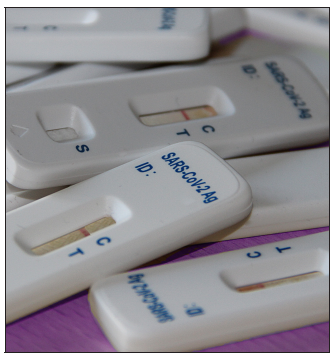
Der Landkreis Lörrach registrierte am Freitag 49 neue Infektionen.